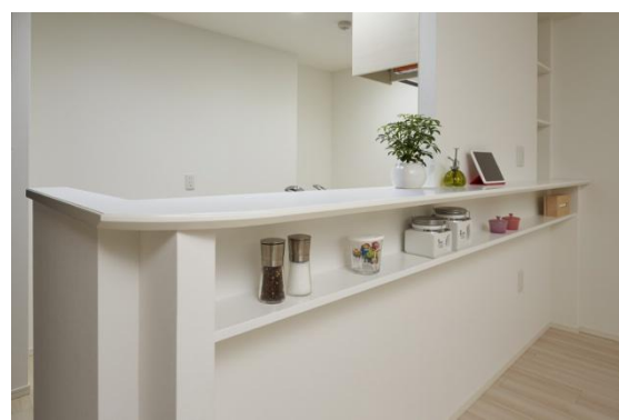
ダイニングカウンター