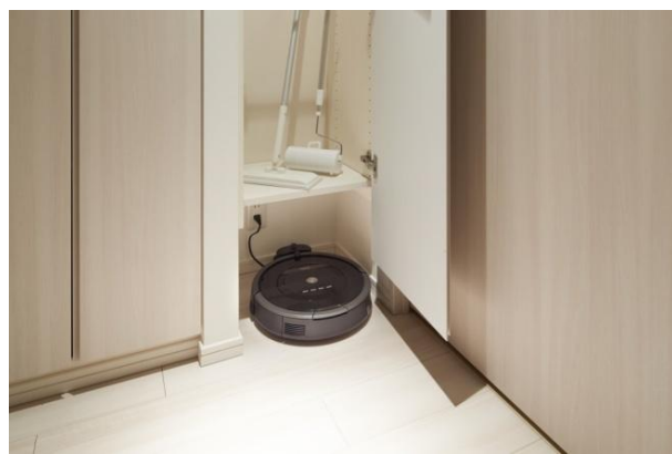
お掃除ロボット収納スペース