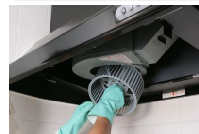
専門清掃を年1回・1ヵ所実施 (参考写真)