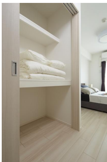
多彩な収納スペース