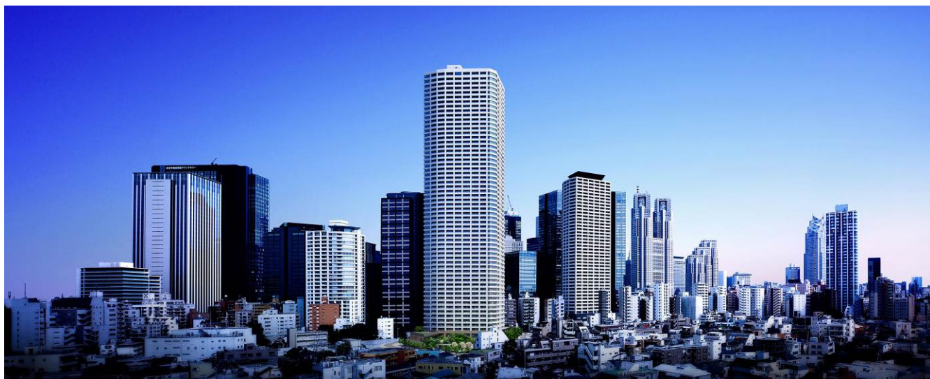
▲「ザ・パークハウス 西新宿タワー60」外観完成予想CG