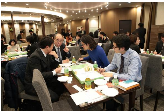
▲ 「HOMETOWN MEETING vol.1」 (1月20日)の様子

今後も定期的にエリアコミュニティプログラムを開催し、入居前からのコミュニティ形成、地域とのつながりを支援してまいります。