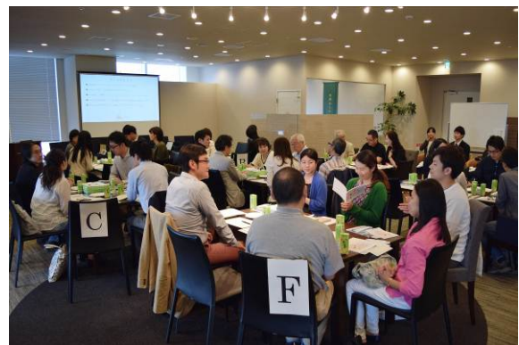
▲ 「HOMETOWN MEETING vol.2」 (5月3日)の様子